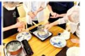
通所の利用者様と十五夜のお供え団子の作成