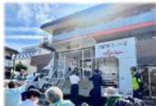
起震車を使った防災訓練