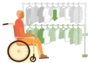
座って干せる環境調整

これからも、利用者様の心情や希望に寄り添い、「やりたい」を叶えていけるよう取り組んでいきたいと思っております。(訪問リハビリ課)